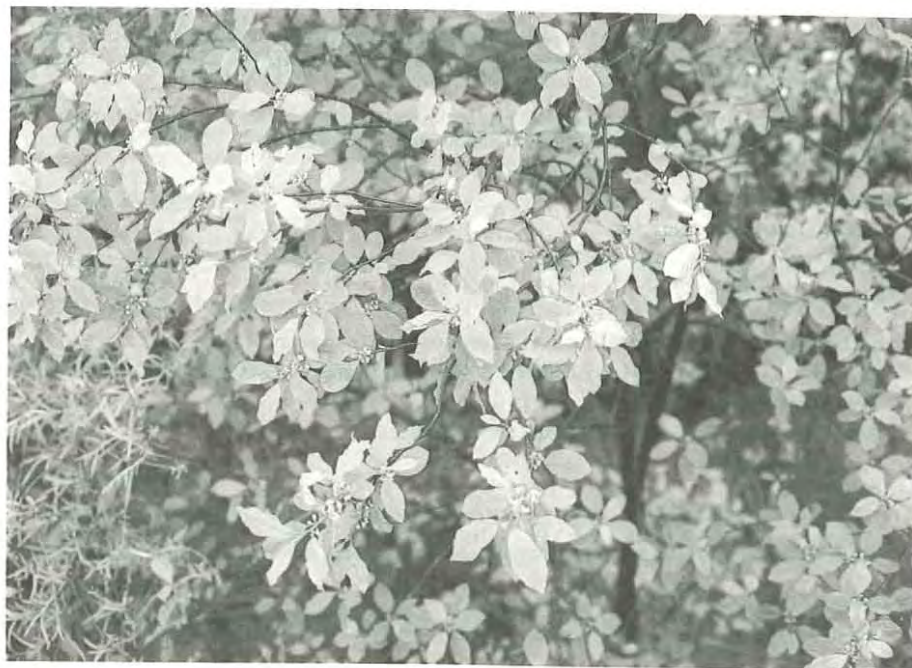
El arraclán ( Frangula alnus ) crece sólo a orillas del río Guarga.