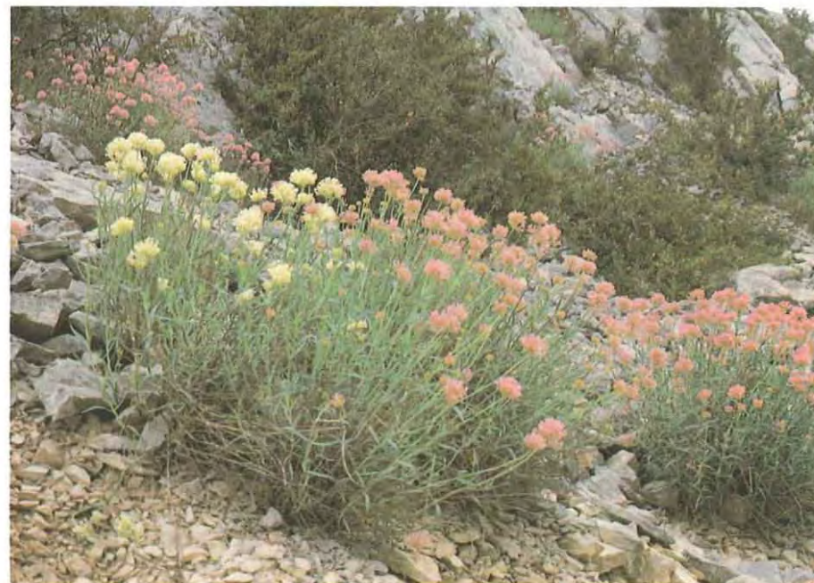
Centranthus lecoqi que coloniza gleras secas del piso montano, presenta a veces flores albinas.