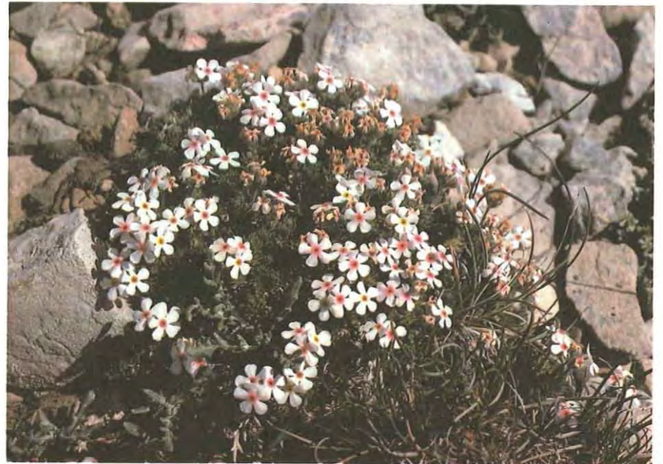
Una primulácea de los roquedos calizos muy rara en las cumbres de Guara: Androsace villosa .