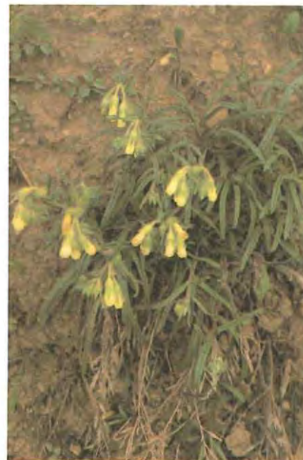
Onosma tricerospes subsp. catalaunica es una borraginácea endémica del Pirineo que en Guara se encuentra solamente en la cuenca del río Guarga.

En los campos de cereales del Somontano.