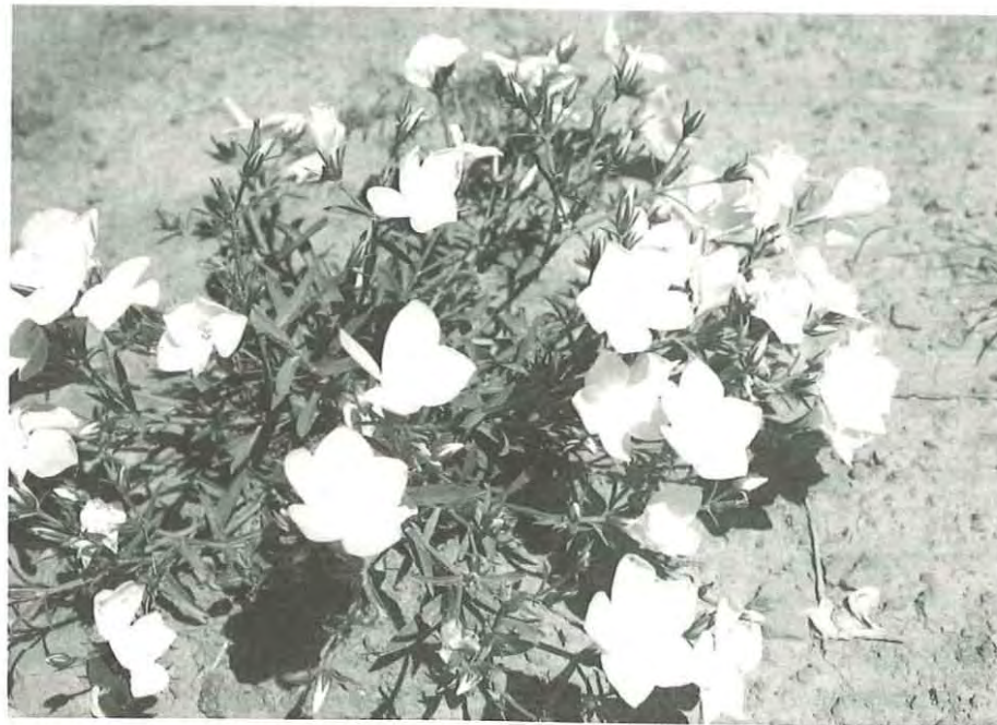
Linum campanulatum es una planta adaptada a los suelos arcillosos y erosionados.

Pastos secos y lugares pedregosos soleados del piso montano inferior. En el Somontano, domina la forma phylloclada (Lange in Willk. & Lange) O. Bolòs & J. Vigo.