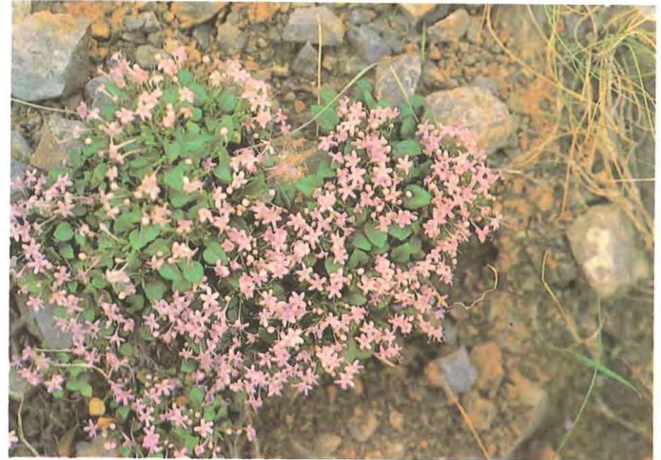
Valeriana longiflora subsp. pavi es una planta especialista de los cantiles calizos y conglomerados endémica de la Rioja y del Pirineo occidental y central.

Crestones rocosos, rellanos y caminos en los barrancos frescos, en el piso montano. Es planta de media sombra y algo nitrófila. En la zona superior y en la solana, crece protegida por el boj e indica las querencias y refugios del ganado lanar. Mucho más rara en los bosques claros.